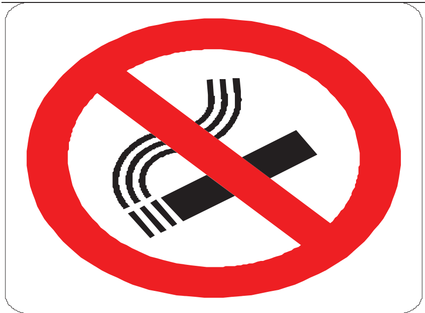
Nome: vietato fumare Posizione: deposito - lavorazione