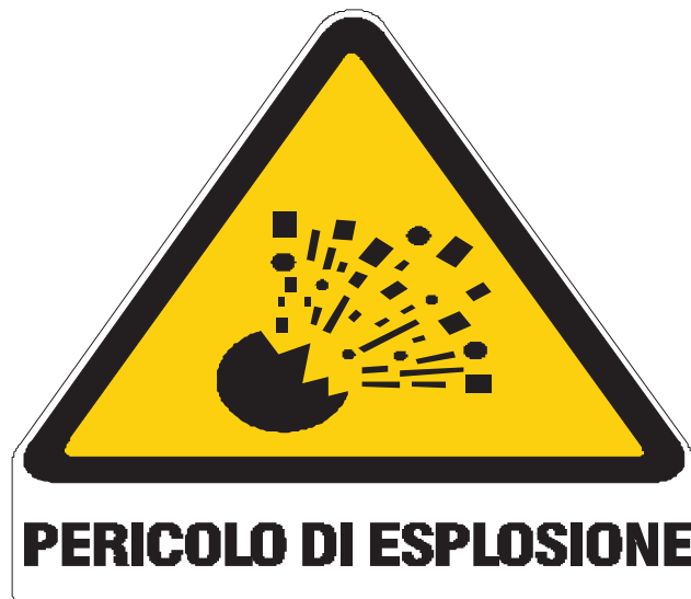
Nome: pericolo esplosione Posizione: deposito