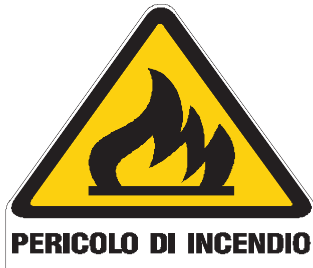
Nome: pericolo incendio Posizione: deposito