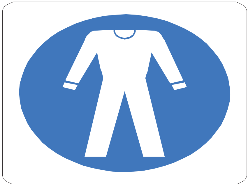
Nome: indumenti protettivi Posizione: All'ingresso del cantiere.